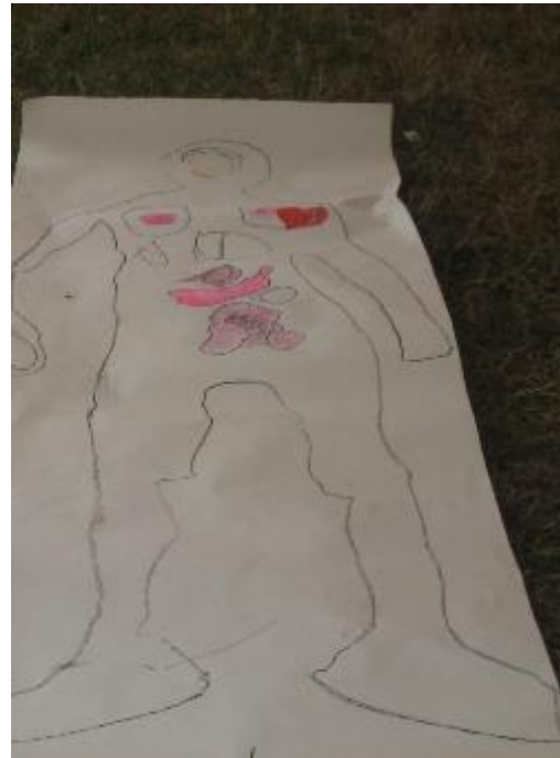
Die Kinder zeichnen sich und kleben die Organe ein