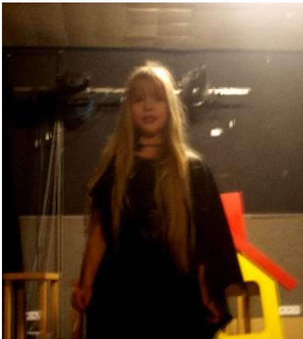
Die Hexe im Theater

In dem Theaterstück geht es um Fabelwesen die in einer Fantasiewelt leben. Auch bittet das Theater um eine kleine Spende. Am Ende des Theaterstücks wurde der Kater getötet. Bitte fragt mich nicht warum.