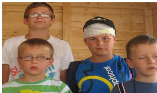
Den Bankmitarbeitern macht es Spaß!