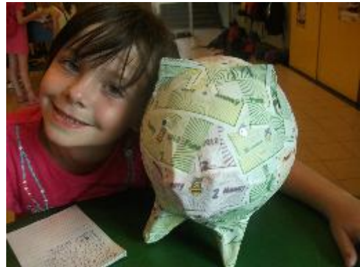
Alle lieben das Funny Money-Schwein