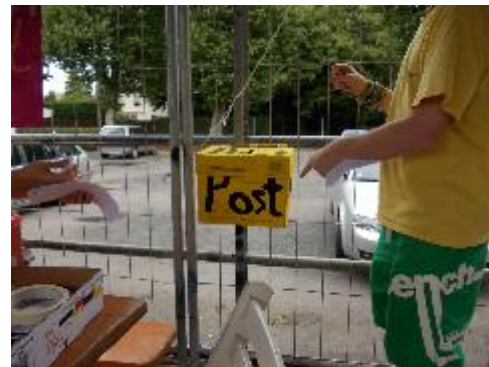
Briefkasten bei der Post