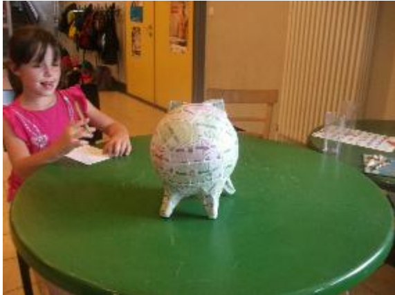
Lena schreibt über das Funny Money-Schwein

Alle Kinder wollen es haben. Da sind 1, 2, 5, Funny Money darauf, von 2012 Es Sieht Cool aus. Es hat Wackelaugen bekommen. Es steht nicht so gut. Es Hat keinen Schwanz. Es hat schöne Ohren. Das Schwein ist von Wernutopia.