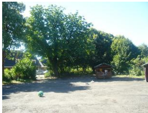
Die Sonne räumt den Hof leer