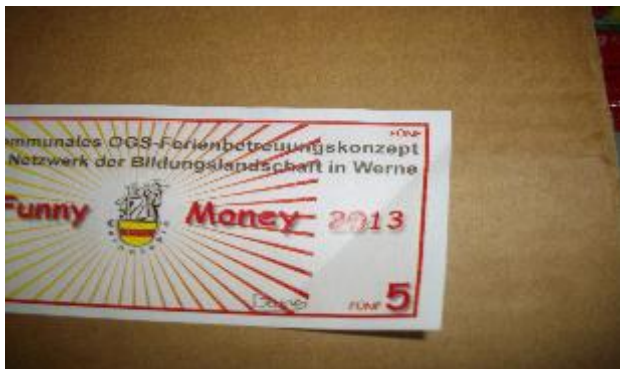
Der Falsche Funny Money