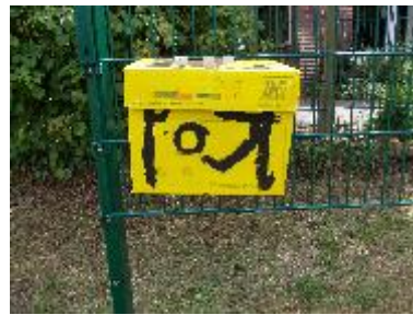
Briefkasten am Rathaus