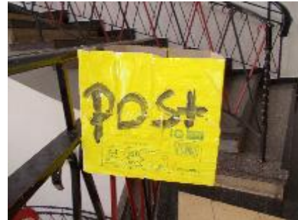
Briefkasten im Flur