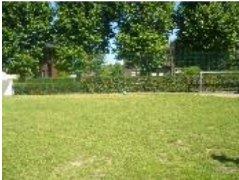
Zu heiß! Keiner will Fußball spielen

In der letzten Woche haben wir eine Umfrage zum heißen Wetter gemacht dabei hat sich ergeben das es vielen Kindern nicht so gut gefällt bei dem heißen Wetter zu arbeiten. Viele wünschen sich eine schöne Abkühlung zum Beispiel Wasserpistolen, einen Pool, Wasserbomben, Rasensprengar, einen Schlauch zum Nassspritzen, viel zu trinken, Sonnenschirme, einen Ventilator und eine Klimaanlage.