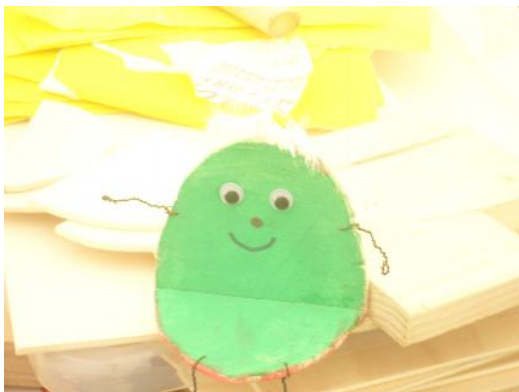
Das hier ist ein Eiermännchen