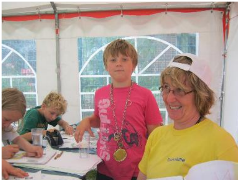
Steuern in Wernutopia: Vize Bürgermeister gibt sich gelassen

Zu diesem Thema wird es heute um 15:00 Uhr eine Versammlung aller BürgerInnen geben. Diese verspricht spannend zu werden.