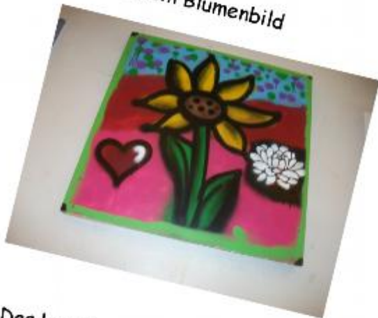
Das kann man in der Schreinerei machen