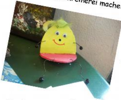
Das kann man aus Ton machen